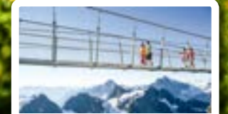
TITLIS CLIFF WALK Europe's highest suspension bridge

A seat reservation and/or supplement is required to travel on some trains/buses/boats such as the Glacier Express, Bernina Express, Gotthard Panorama Express and Palm Express.