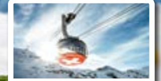
TITLIS ROTAIR First revolving cable car