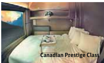
Canadian Prestige Class