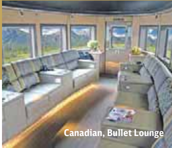
Canadian, Bullet Lounge