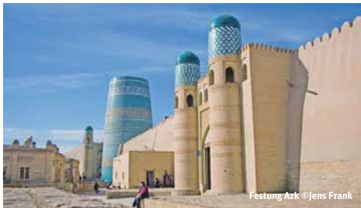
Festung Ark