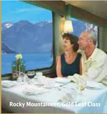
Rocky Mountaineer, Gold Leaf Class